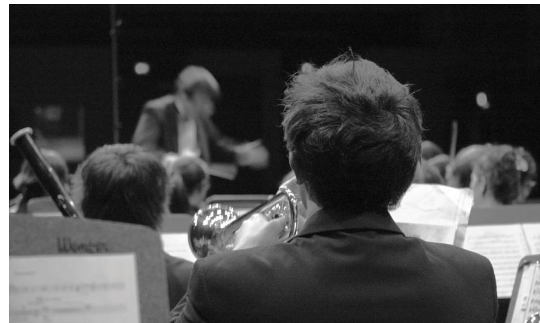
Concert Mai 2006

Adresse électronique : info@lapjm.org Adresse postale : Philharmonie jeunesse de Montréal 1965, boul. Laird Mont-Royal (Québec) H3P 2V2