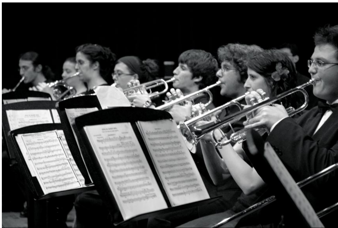
Concert Mai 2006

L'Arlésienne est avant tout le nom d'une pièce de théâtre d'Alphonse Daudet pour qui Bizet composa un accompagnement. La pièce eut un maigre succès, mais Bizet s'assura que son œuvre ne tombe pas dans l'oubli et en fit une version orchestrale sous la forme d'une suite. Son succès fut tel que, quatre ans après la mort de Bizet, Ernest Guiraud orchestra une seconde suite à partir du matériel initial restant. Farandole provient de cette deuxième « compilation » et est probablement l'air le plus connu de l'œuvre. Il est amusant de noter que ce mouvement, que l'on associe maintenant à Noël, au froid et aux Rois Mages, provient d'une pièce racontant l'histoire de deux jeunes provençaux amoureux d'une jeune fille habitant Arles, une ville chaude et ensoleillée.